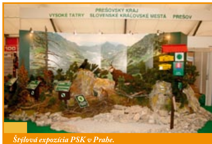
Štýlová expozícia PSK v Prahe.