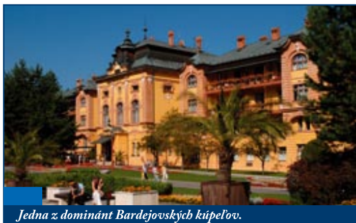
Jedna z dominant Bardejovských kúpeľov.

ktoré tvoria malebné dedinky. Pribudli zrekonštruované cestné komunikácie II. a III. triedy na území okresu. Rekonštruovali sa dopravné subsystémy za účelom