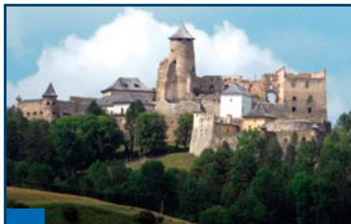
Hrad v Starej Ľubovni otvára svoje dvere aj túto sezónu.

Na rekonštrukciu a modernizáciu ciest v správe PSK vyčlenili poslanci 47,2 milióna Sk. Za tieto financie sa napríklad opraví prístupová cesta na horu Zvir v Litmanovej, dofinancuje sa kruhový objazd v Medzilaborciach, opraví sa cesty v okrese Sabinov,