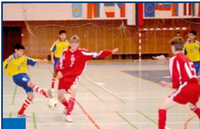
Minuloročný medzinárodný futbalový turnaj nepočujúcich.

Od roku 2004 Prešovský samosprávny kraj prideli dotácie z vlastných príjmov na všestranný rozvoj územia PSK a na podporu všeobecne prospešných služieb. Aj v tomto roku rozdelí žiadateľom z celého kraja financie na podporu rôznych aktivít. V tomto roku kraj rozdelí celkovo 3 milióny korún podľa stanov Všeobecne záväzného nariadenia č. 5/2004, pričom o polovici, sume 1,5 milióna korún, rozhodujú poslanci krajského parlamentu.