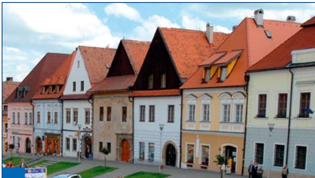
Charakteristická architektúra mesta Bardejov.

M esto Bardejov je centrom horného Šariša. Bardejovský región je veľmi pestrý, rozmanitý. Tak ako každý z regiónov Prešovského kraja má svoje špecifiká. Prednosti, ktorými sa rád prezentuje, ale i nedostatky, ktoré chce odstraňovať. Co všetko sa už v tomto volebnom období podarilo v tejto časti kraja splniť? Čo obyvateľov Bardejova a okolia najviac trápi? Aké sú priority? Opýtali sme sa sexteta poslancov Prešovského samosprávneho kraja z bardejovského regiónu.